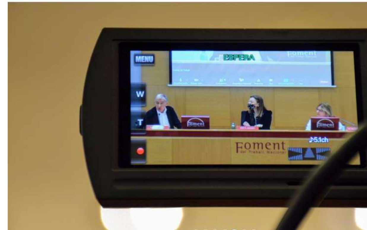
El president de FEACEM Catalunya, durant la seva intervenció, vista des del visor d'una càmera